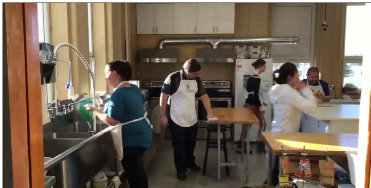
Capture d'écran du montage vidéo

Au Centre de formation générale Le Macadam, les élèves ont participé à un projet qui implique plusieurs volets.