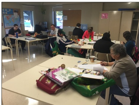
Classe en intégration sociale au Centre L'Horizon