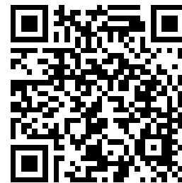
Ce code QR réfère au balado L'Histoire des Abitibiwinnik

Un article de ce projet réalisé au centre Le Macadam est disponible sur le site Internet du Service régional à cette adresse : recitfga0810.nordtic.net/spip.php?article181 .